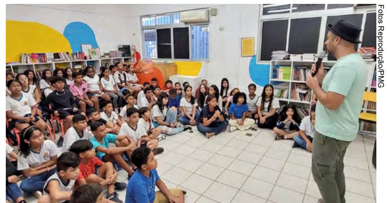
Para Cascabulho, percorrer as escolas foi uma experiência única

Ambos receberam o Certificado do secretário de Educação de Guarujá, que considerou o projeto uma ferramenta que une dois aspectos: o incentivo à leitura e a consciência ambiental. "A obra enriquece o aprendizado dos nossos alunos. Além dos esforços da Seduc, os estudantes demonstraram muito interesse na iniciativa", destacou o titular da pasta.