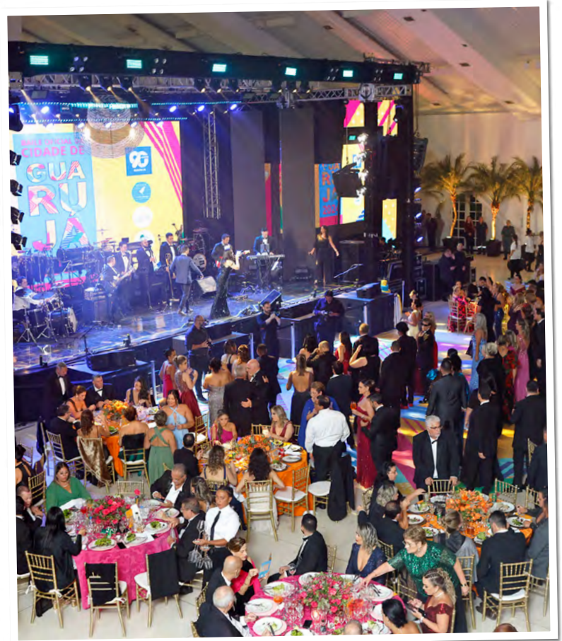
Quase 1.000 pessoas se engajaram na causa solidária

A presidente do Fundo Social salientou a participação dos munícipes. “Eu agradeço a todos por esse compromisso junto ao Fundo Social de Solidariedade. Ao engajamento de cada um. Foi um baile em que trabalhamos pensando em cada detalhe, para todos se divertirem ao máximo, e por uma causa nobre, que deixa tudo ainda mais especial”, declarou.