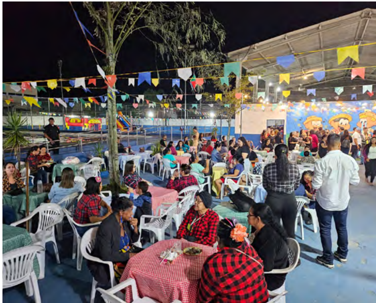
Caec Dante Sinópoli encerra agenda de festejos juninos no próximo sábado

Neste penúltimo festejo, além de degustar caldos, bolos e tortas, o público pôde incentivar a feira de empreendedorismo, se divertir nos brinquedos infláveis e prestigiar as apresentações das turmas de caratê, ritmos e funcional. Entre os convidados, que agitaram o público, estavam, ainda, o 'Grupo Se Joga', 'Ballet Aprendizarte', 'Patine Escola de Patinação' e a quadrilha juni-