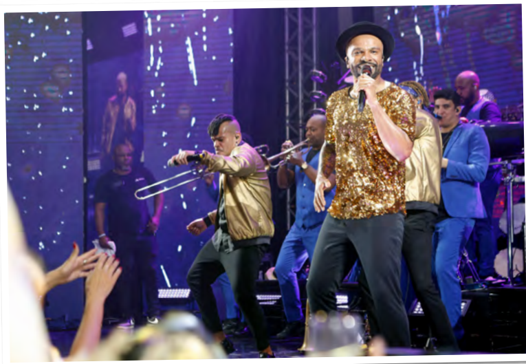
Sucessos de ontem e hoje embalam a noite no Casa Grande Hotel