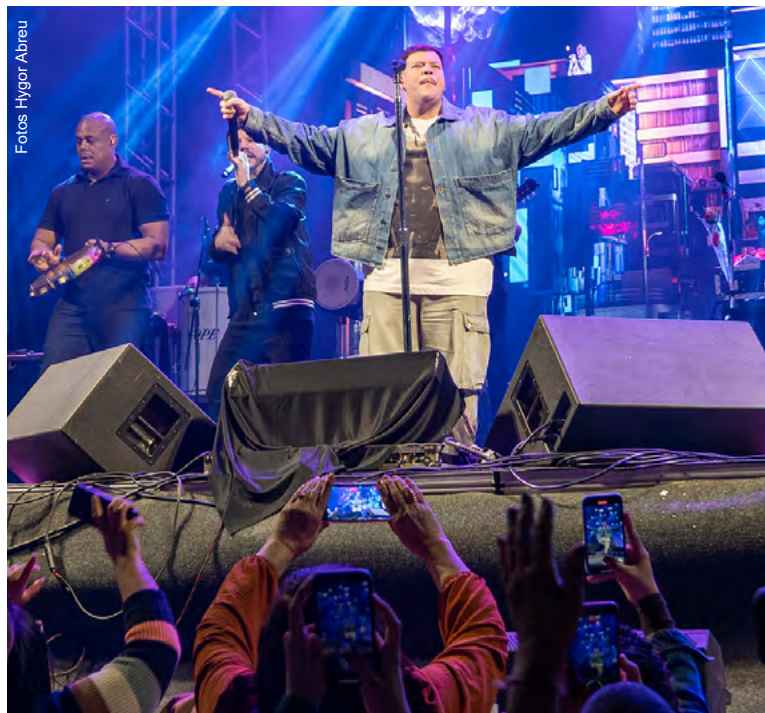
Público cantou os maiores sucessos de Ferrugem na Praça Horácio Lafer

“De rolé por Guarujá, aqui na Praia da Enseada, para a gente se encantar”. A frase dita pelo cantor Ferrugem, ainda no camarim, antes de subir ao palco na Praça Horácio Lafer, no último domingo (30), resumiu o show que marcou o aniversário de 90 anos de Emancipação Político-Administrativa da Cidade. No local, 15 mil pessoas cantaram a plenos pulmões os principais sucessos do sambista. Já na sexta-feira (28), 7 mil pessoas estiveram na Praça 14