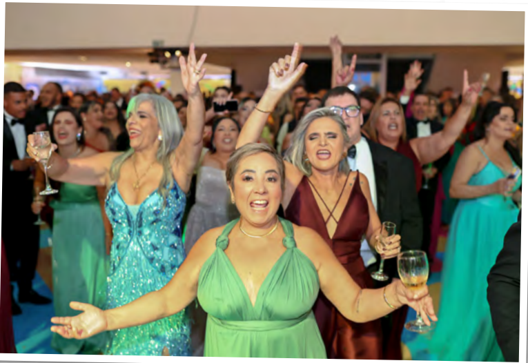
Público cantou e dançou sem parar no show solidário