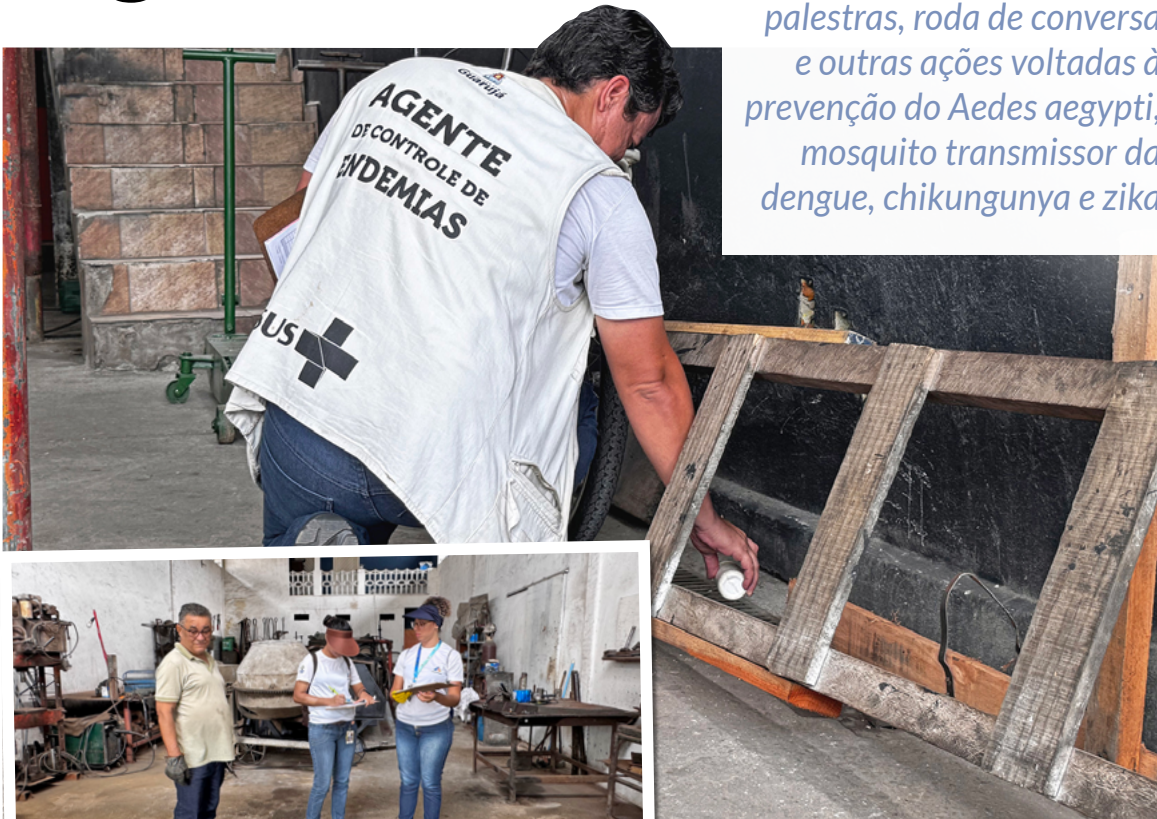
Pontos estratégicos como oficinas, por exemplo, serão monitorados pelos agentes

Em alusão à Semana Estadual de Mobilização Social para o Combate às Arboviroses, a Prefeitura de Guarujá preparou uma programação especial, que começa segunda-feira (11), e será realizada até o próximo sábado (16). A ação é capitaneada pela equipe de Combate e Controle às Endemias, vinculada à Secretaria Municipal de Saúde (Sesau).