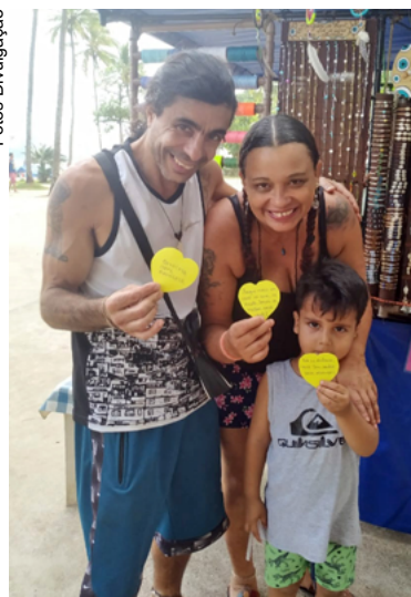
Haverá distribuição de corações amarelos com mensagens positivas

Um exemplo inspirador é o 'Doe Sentimentos Positivos', que desde 2014 tem iluminado corações e mentes em diversas partes do mundo. Atualmente, o projeto tem adeptos e participantes em 57 cidades brasileiras, estendendo seus braços afetuosos para países como Canadá, Portugal, Inglaterra e Chile.