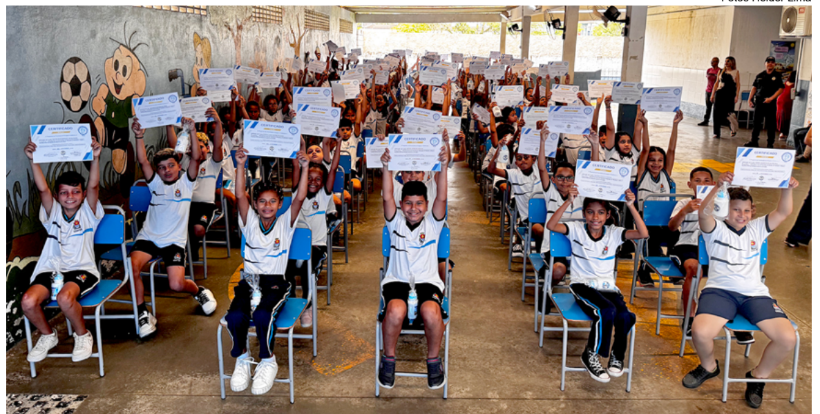
Certificados foram entregues aos alunos das escolas Myrian Terezinha e Angelina Daige

Ao todo, cinco representantes de classe pegaram os diplomas de forma simbólica, além dos professores das turmas do 5º ano, que pela parceria tam-