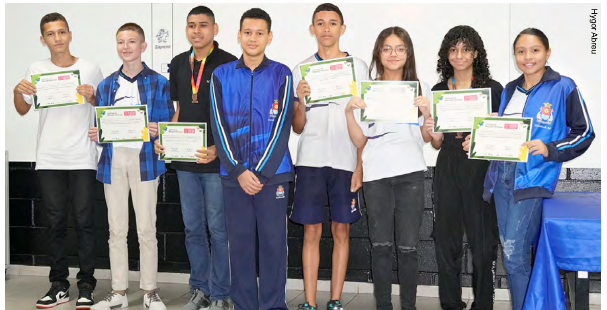
Foram entregues medalhas de ouro, prata e bronze para seis alunos e 18 menções honrosas com certificação

Buscando celebrar a dedicação de seus alunos, foram entregues medalhas de ouro, prata e bronze para seis estudantes e 18 menções honrosas com certificação. Além disso, os alunos realizaram apresentações musicais de sucessos como 'Tempo Perdido', da Legião Urbana, e 'Velha Infância', dos Tribalistas.