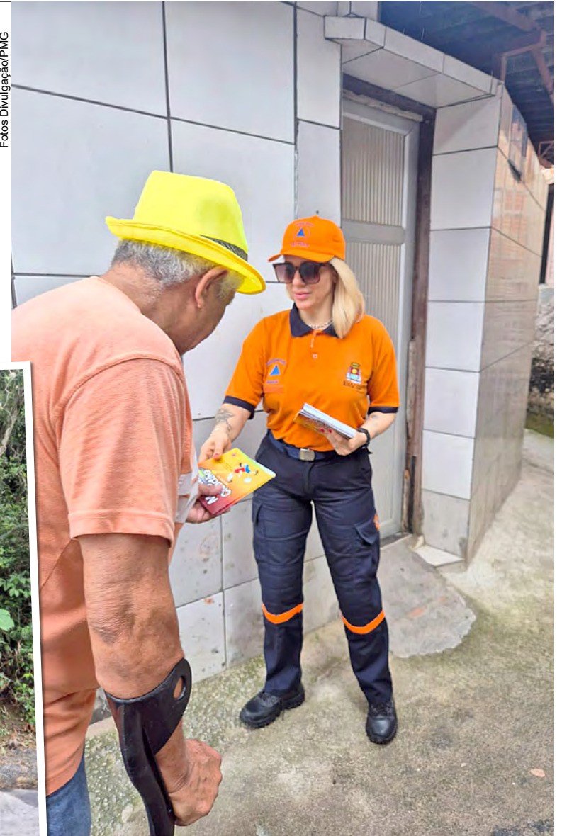
Pessoas que residem em áreas de risco devem estar sempre atentas às orientações da Defesa Civil

tar sempre atentas às orientações da Defesa Civil, tais como: preservar o meio ambiente do entorno da residência; não construir ou ampliar moradias em áreas de risco geológico sem orientação técnica adequada e, ainda, nunca jogar lixo nas ruas, pois dificulta o escoamento das águas pluviais.