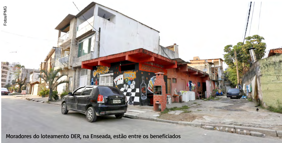
Moradores do loteamento DER, na Enseada, estão entre os beneficiados