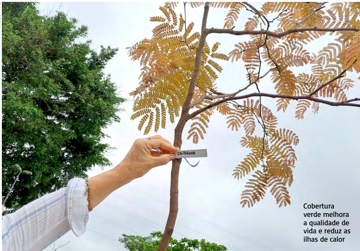
Cobertura verde melhora a qualidade de vida e reduz as ilhas de calor

Os munícipes de Guarujá podem plantar suas próprias mudas de árvores em áreas públicas, desde que sigam as orientações estabelecidas pela Lei de Arborização da Cidade. Para garantir o plantio adequado e evitar problemas futuros, a solicitação deve ser feita à Prefeitura, por meio da Secretaria de Meio Ambiente e Segurança Climática (Semam), que avaliará a viabilidade do local e a escolha da espécie ideal para o plantio.