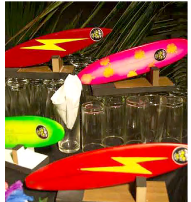
Programação tem treinamento, homenagens e entrega de kits e troféus