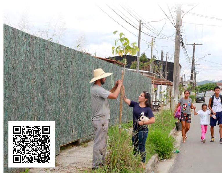
Responsabilidade pela manutenção é partilhada entre Prefeitura e munícipes

A Semam destaca ainda que a participação da comunidade é fundamental para o sucesso do plano. "A colaboração dos munícipes é muito importante, assim garantimos